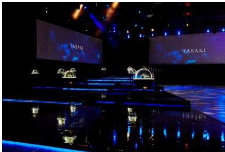
「TASAKI TIMEPIECES」が展示された会場の様子

高級腕時計コレクション「TASAKI TIMEPIECES」と、新作ジュエリーコレクション「Curiosity」の登場により、ハイジュエラーTASAKI のモダンで洗練された世界観をより幅広いアイテムでご堪能いただけます。